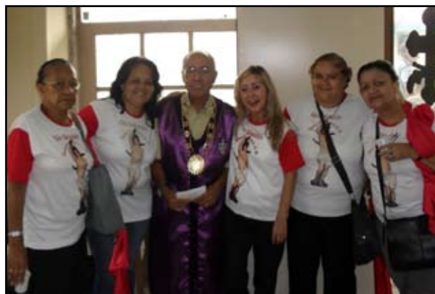
Caminhada de São Sebastião