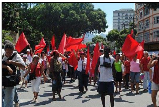
Pascom de todas as paróquias na caminhada de São Sebastião

Que São Sebastião peça a Cristo a Paz foi o desejo de todos nós que o acompanhamos durante esses nove dias.