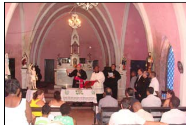
Caminhada de São Sebastião: Visita a Presídios