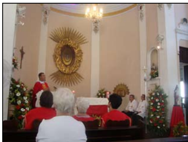
Missa de São Sebastião na nossa paróquia