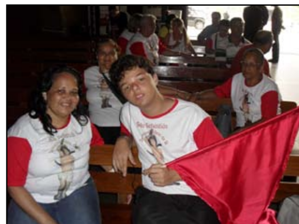
Membros da Paróquia na Caminhada de São Sebastião