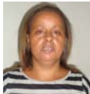
Parte dos integrantes da Equipe do Dízimo