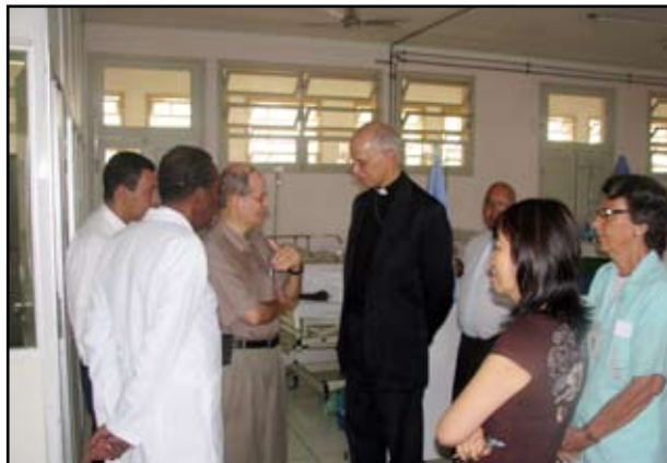
Visita às enfermarias do HUPE