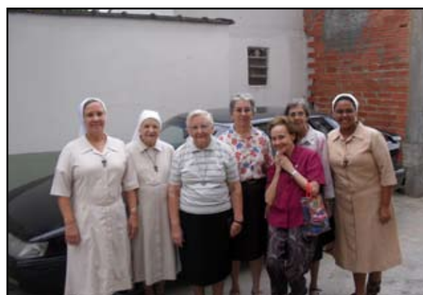
Religiosas que se encontraram com o Bispo durante a visita