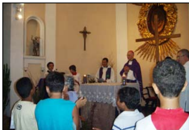
Missa das crianças