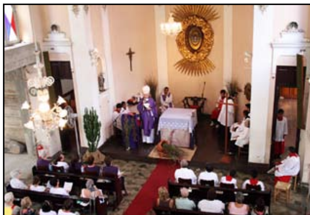
Missa Comunitária de 28 de fevereiro