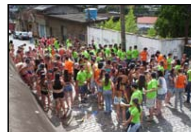
Bullying e trotes violentos: humilhações sem sentido que podem comprometer o estado emocional dos jovens

Para o bem de todos temos o desafio de incentivar uma cultura de respeito e paz, onde todos são responsáveis (famílias, escolas e parceiros). É uma tarefa em conjunto.