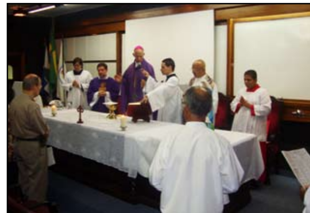
Missa celebrada pelo bispo no HUPE