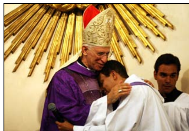
Encerramento da Visita Pastoral