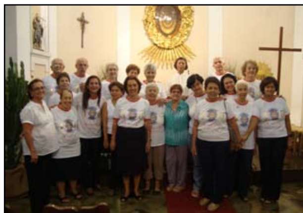
Membros da equipe da Liturgia

A comentarista inicia lendo a mensagem do folheto da missa, antes das leituras e no final a vivência, que é a mensagem proposta para ser meditada ao longo da semana.