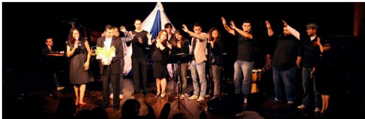
Show Canto de Paz, que aconteceu na UERJ