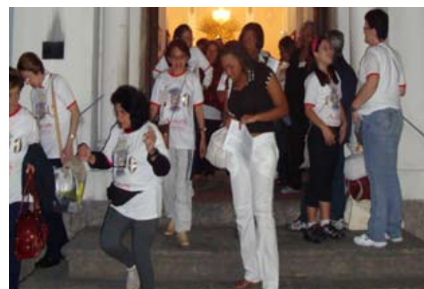
Flagrante da partida da Romaria rumo ao Santuário Nacional de Nossa Senhora Aparecida