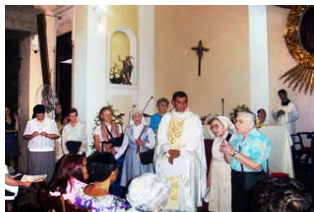
Homenagem da paróquia pelo dia das Religiosas