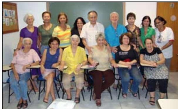
Parte dos integrantes do Círculo Bíblico

Começamos nossos encontros com uma oração, uma preparação para ouvir a palavra de Deus. Uma leitura do AT ou do NT, e depois do Santo Evangelho. A palavra de Deus (Bíblia) não é só um livro de estudo, mas um livro que precisa ser meditado, rezado, vivenciado. É necessário saborear esta palavra e, sobretudo testemunhá-la. Queremos ver Jesus, Caminho, Verdade e Vida. Os Círculos Bíblicos são espaços fecundos de aprofundamento e vivência da palavra de Deus em família.