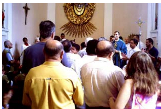
Missa comemorativa ao dia dos Pais