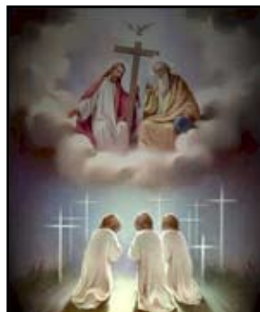
Indulgências no Ano Sacerdotal

E o que seriam as indulgências e como obter tal graça diante da Igreja? Segundo o Código de Direito Canônico, “indulgência é a remissão, diante de Deus, da pena temporal devida pelos pecados já perdoados quanto à culpa, que o fiel, devidamente disposto e em certas e determinadas condições, alcança por meio da Igreja, a qual, como dispensadora da redenção, distribui e aplica, com autoridade, o tesouro das satisfações de Cristo e dos Santos” (Cân. 992). “Para que alguém seja capaz de lucrar indulgências, deve ser batizado, não estar excomungado e encontrar-se em estado de graça, pelo menos no fim das obras prescritas e para que a pessoa capaz lucre de fato as indulgências, deve ter pelo menos a intenção de as adquirir, e deve cumprir os atos prescritos no tempo estabelecido e no modo devido, segundo o teor da concessão” (Cân. 996 §§ 1 e 2).