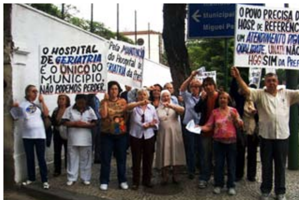
Movimento contra o fechamento do Hospital Geriátrico Miguel Pedro