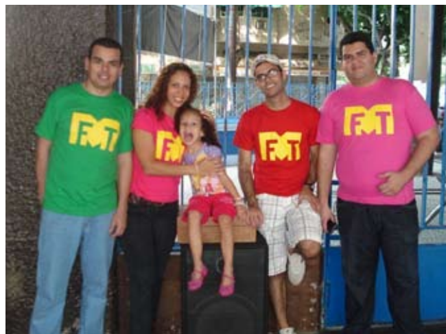
Integrantes do Ministério de Música Filhos Teus

Apesar de termos características bem diferentes um do outro, o Ministério de Música Filhos Teus já se tornou uma família. Temos prazer em estarmos juntos e uma sintonia, amizade, afinidade e fé, que nos une e nos faz seguir adiante até onde e quando Deus quiser.