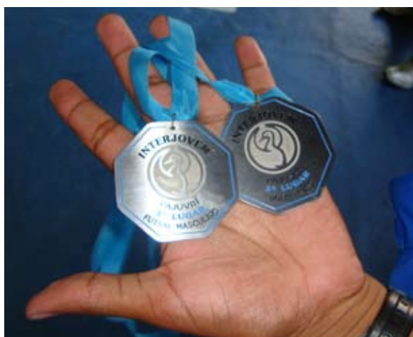
As medalhas conquistadas