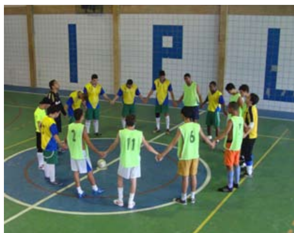
Momento de oração antes da partida