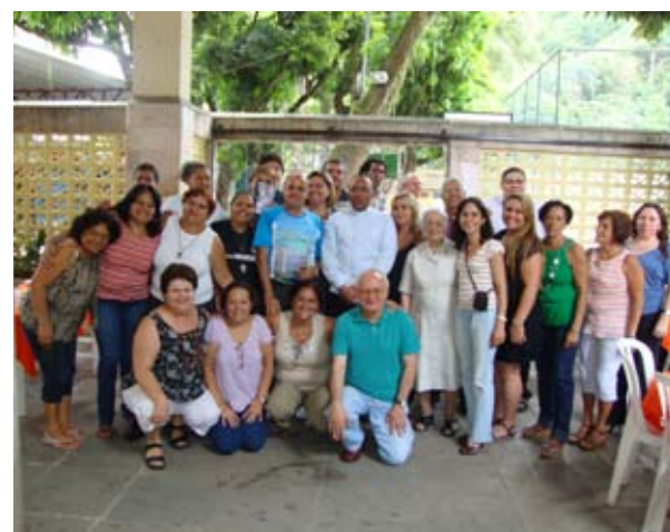
Integrantes da PasCom de diversas paróquias em confraternização