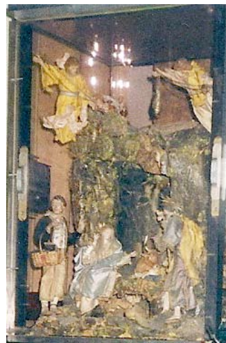
1º presépio criado por São Francisco de Assis